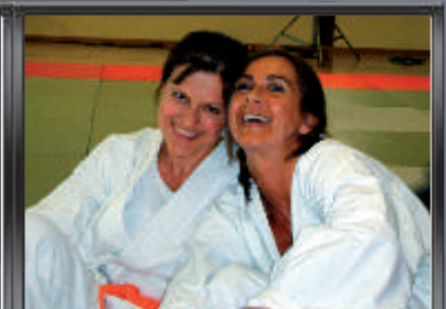
Spaß am Sport