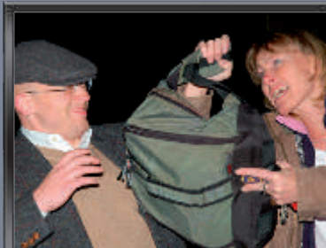
Alltagsobjekte zur Abwehr